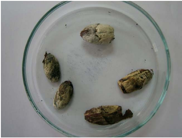
Slika 3. Žir zaražen gljivom Phomopsis spp. Figure 3 Acorninfectedbyfungus Phomopsis spp.

gljive ali na žiru u skladištu imaju ulogu slabih parazita i mogu uništiti klicu, uzrokovati trulež te time utjecati na smanjenje klijavosti.