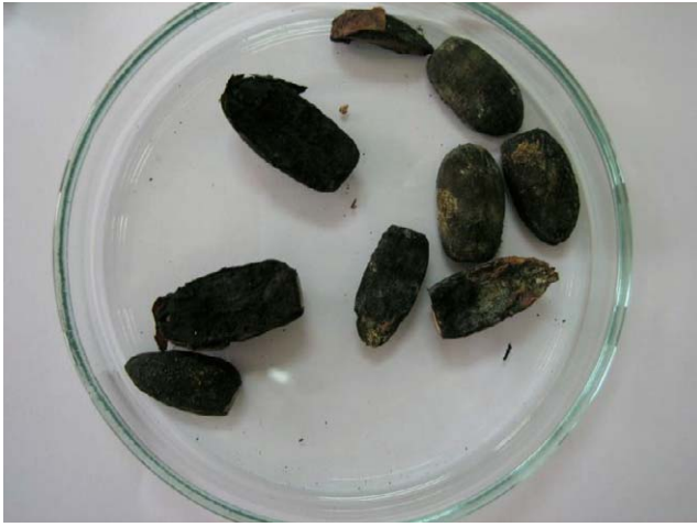
Slika 4. Žir zaražen gljivom Ciboriabatschiana Figure 4 Acorn infected by fungus Ciboriabatschiana