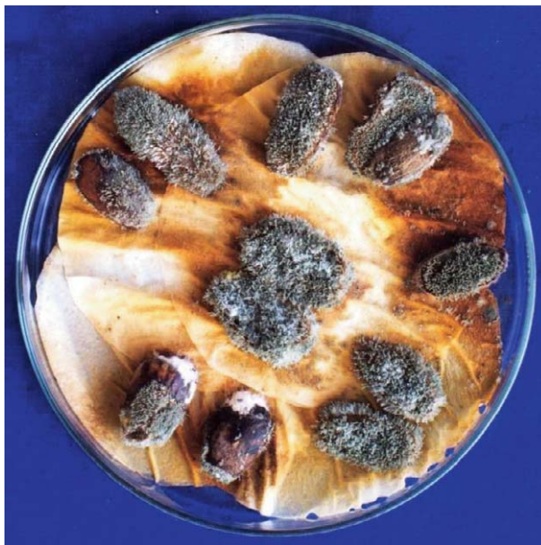
Slika 2. Žir zaražen gljivom Penicilliumglandicola Figure 2 Acorninfectedbyfungus Penicillium glandicola

Odnos vrsta gljiva na bolesnom žiru prikazan je na Slici 1. Većina od njih je prisutna u svim istraživanim sastojinama osim Alternariaalternata i Stereumhirsutum koje su utvrđene samo u starijoj sastojini. Najveći postotak žira bio je zaražen gljivom Penicillium glandicola (Slika 2.) te drugim Penicillium vrstama. Penicillium vrste su česte u skladišnim uvjetima, na sjemenu s nižim sadržajem vlage. One su saprofitske