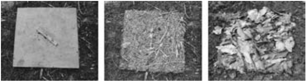
Slika 3. Prikaz uzorkovanja listinca Figure 3 Leaf litter sampling

Iz podataka dobivenih analizom utvrđena je značajno veća akumulacija listinca u kulturama smreke od akumulacije listinca u prirodnim sastojinama hrasta lužnjaka i običnog graba.* Najveća masa listinca nalazi se u kulturi smreke na plohi TIII i iznosi 31158,4 kg/ha, dok je najmanja masa listinca u prirodnoj sastojini na plohi OI i iznosi 9539,2 kg/ha. U prosjeku je masa listinca u kulturama smreke 2 do 3 puta veća od one u prirodnim sastojinama hrasta lužnjaka i običnog graba. Ako se promatraju prosječne vrijednosti (aritmetičke sredine), količina listinca u prirodnim sastojinama kreće se od 9539,2 do 10604,8 kg/ha, dok za kulture smreke iznosi od 17593,6 do 31158,4 kg/ha. Sam raspon količine listinca izrazito je varijabilan i znatno je veći kod kultura smreke (Slika 3., Tablica 3.).