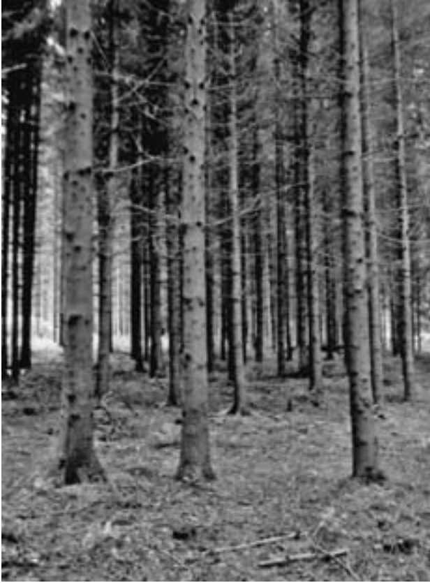
Slika 2. Smrekova kultura na lokalitetu TI Figure 2 spruce culture in the locality TI

409 m 3 ha -1 bukva sudjeluje s 328 m 3 i 146 stabala te obični grab s 71 m 3 i 145 stabala. Na plohi OIII u drvnoj zalihii od 450 m 3 ha -1 obična bukva sudjeluje s 380 m 3 i 143 stabla, obični grab s 22 m 3 i 25 stabala te hrast lužnjak s 48 m 3 i 15 stabala.