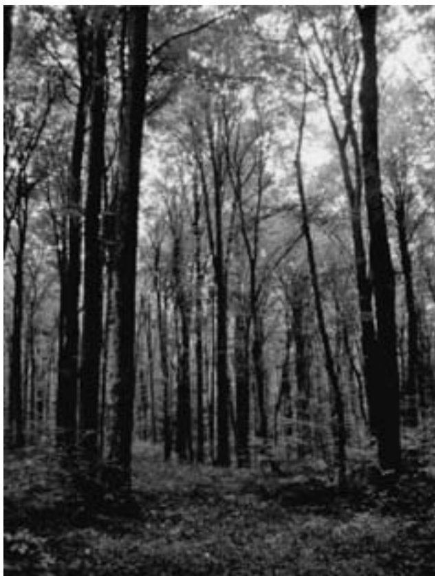
Slika 1. Prirodna sastojina (uređajni razred bukve) na lokalitetu OIII Figure 1 Natural stand (management class of beech) in the locality OIII