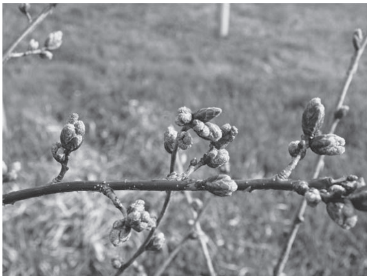
Slika 4. Trenutak kada nastupa mejoza majčinskih stanica polena predstavlja završnu fazu razvoja polenovih zrnaca što se kod hrasta lužnjaka odvija za vrijeme otvaranja pupova i početka izduživanja muških resa.

Figure 4 The moment of the onset of meiosis of pollen mother cells is the final phase of pollen grains development which in the Pedunculata oak takes place during the opening of buds and beginning of male catkins elongation