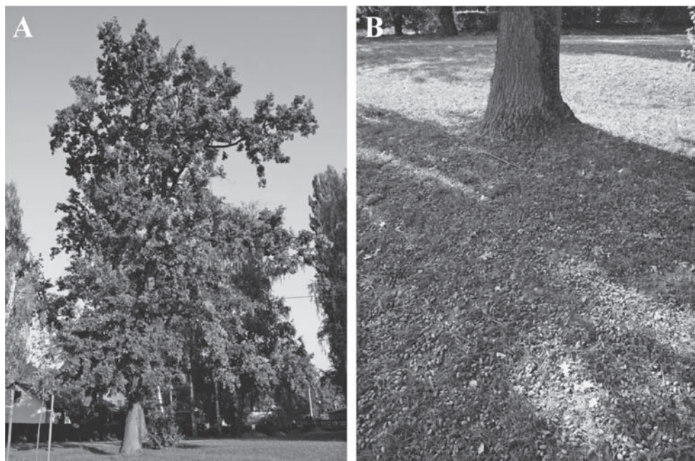
Slika 2. Fotografija stabla na osami u neposrednoj blizini „nove“ zgrade Šumarskog fakulteta snimljena krajem rujna 2009. godine (prikaz A). Tlo prekriveno žirom ispod istoga stabla (prikaz B) ukazuje kako je ono 2009. godine urodilo velikom količinom žira. Iste godine u gospodarskim sastojinama urod je bio izuzetno slab. Primjerice, na području Spačve 2009. godine hrast lužnjak je urodio sa svega 4,5 kg žira po ha (neobjavljeni podaci).

S obzirom na sve što je do sada navedeno, u daljnjem tekstu ukazujemo na rizik mogućega donošenja krivih zaključaka o plodonošenju šumskoga drveća na temelju usporedbe podataka o količini i periodicitetu uroda nekada i danas. Primjerice, Matić i dr. (1996a, 1996b) uspoređuju vlastite podatke o količini uroda i kakvoći žira prikupljane od 1976. do 1995. godine u gospodarskoj sastojini hrasta lužnjaka staroj 147 godina s podacima koje su iznijeli Radošević (1888) i Perušić (1917). Pri tom je zanemarena činjenica da je Perušić (1917) svoje istraživanje proveo u šumi „žirovnjači“ vrlo rijetkoga i isprekidanoga sklopa, koja je obrasla stablima hrasta lužnjaka „poljskoga tipa“. Ta stabla odlikuju se kratkim deblom i velikom krošnjom (slika 1). Sastojine obrasle takvim stablima u Perušićevo vrijeme služile su za ispašu