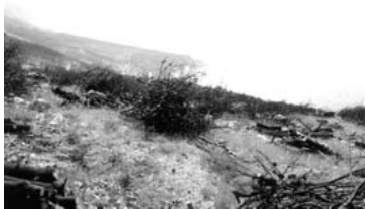
Fotografija 1. Sanacija opožarene površine slaganjem na hrpe, ploha 1, Šumarija Split, srpanj 2001.

Tijekom 2001. godine obavljen je obilazak terena te su izabrane tri pokusne plohe. Prva pokusna ploha postavljena je na području Šumarije "Split", Gospodarske jedinice "Omiška Dinara", odjel 8f, šumski predjel Plani rat. Sastojina je