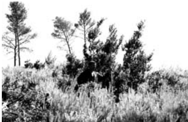
Fotografija 4. Prirodna sukcesija i povratak autohtone vegetacije na pokusnoj plohi 2, Šumarija "Korčula", G.j. "Šakanj rat", odjel 15a, šumski predjel Brna, srpanj 2002. godine, Photo 4 Natural succession and return of autochthonous vegetation on experimental plot No. 2, Forest Office Korčula, M.U. Šakanj rat, department 15a, forest site Brna, July 2002.

bora kretao se od 56.210 (2002.) do 105.628 (2003.) po ha. Ovdje treba naglasiti autohtonost alepskog bora na ovom području. Mogućnost ovakvih rezultata tumačimo činjenicom kako je sjeme alepskog bora došlo sa susjednih površina te njegovom sposobnošću da preleži. Za alepski bor DAFIS (1991) navodi kako zadržava klijavost sjemena u češeru na stablu do 15 godina. Sjeme klije dok padne 20-30mm kiše te 3-4 godine, i stoga šuma nije uniformne visinske strukture. Isti autor smatra kako poslije požara, zbog gore navedenih razloga, ne treba činiti nikakve zahvate sanacije, osim izgorena stabala posjeći (usitniti) prije jesenskih kiša.