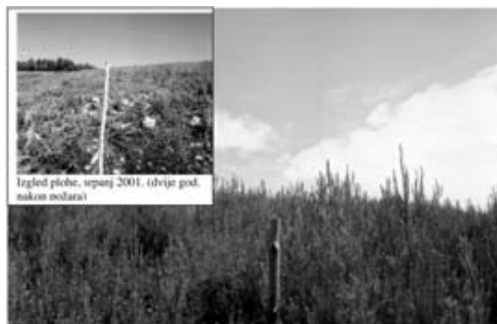
Fotografija 5. Prirodna sukcesija šest godina nakon požara, ploha 3, srpanj 2005. (mlade biljke alepskog bora u potpunosti prekrivaju opožarenu površinu)

Graph 1 Number and height development of Aleppo pine plants by height-age classes based on the 150 m 2 sample on experimental plot No. 3, (absolute and relative values) for monitoring period 2001 – 2005