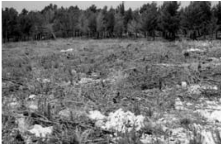
Fotografija 3. Sanacija opožarene površine na plohi 3, Šumarija Šibenik, - usitnjeni izgoreni materijal posložen po tlu, srpanj 2001. Photo 3 Sanation of forest-fire site on experimental plot No. 3, Forest Office Šibenik, - burnt material is chipped and pressed down to the ground, July 2001

opožarena 2000. godine. Druga pokusna ploha postavljena je u Šumariji "Korčula", Gospodarskoj jedinici "Šaknja rat", šumski predjel Brna, odjel 15a. Sastojina je opožarena 1998. godine. Treća pokusna ploha postavljena je na samoj granici Gospodarske jedinice "Rimnjača", Šumarije "Šibenik", odjel 129e, šumski predjel Žurića brdo i Nacionalnog parka "Krka", predjel Brdo Svete Kate. Sastojina je opožarena 1999. godine. Plohe imaju bogatu fotodokumentaciju tijekom godina istraživanja.