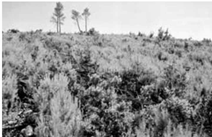
Fotografija 2. Sanacija opožarene površine metodom pruganja, ploha 2, Šumarija Korčula, srpanj 2002. (Snimio: T. Dubravac)

Photo 1 Sanation of forest-fire site by piling of burnt material, experimental plot No. 1, Forest Office Split, July 2001 (Photo: T. Dubravac)