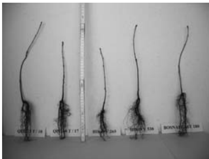
Slika 2. Utjecaj kontejnera na razvoj korijena Photo 2. Influence of container on root development