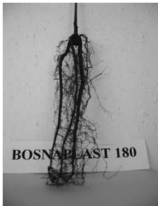
Slika 3. Korijen iz Bosnaplast kontejnera Photo 3. Root from Bosnaplast container